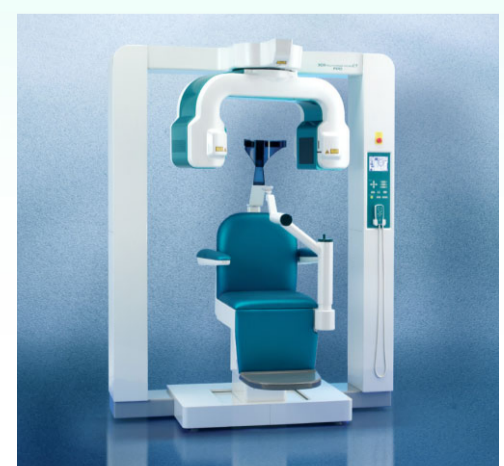
歯科用CT X線装置 3DX マルチイメージマイクロCT