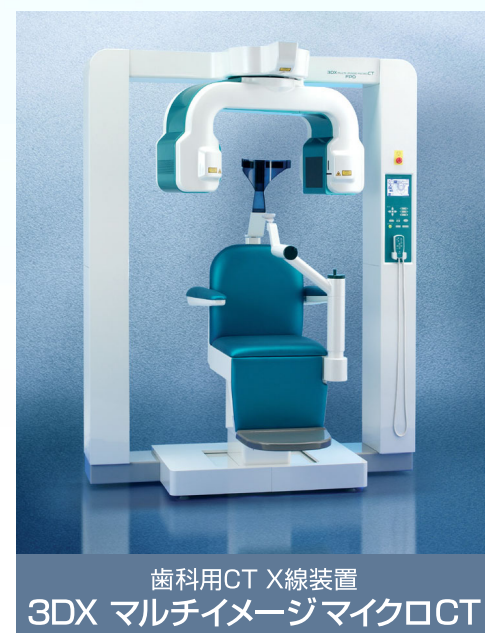
歯科用CT X線装置 3DX マルチイメージマイクロCT